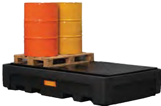
Bac CUBI-PE 1100/2, caillebotis PE