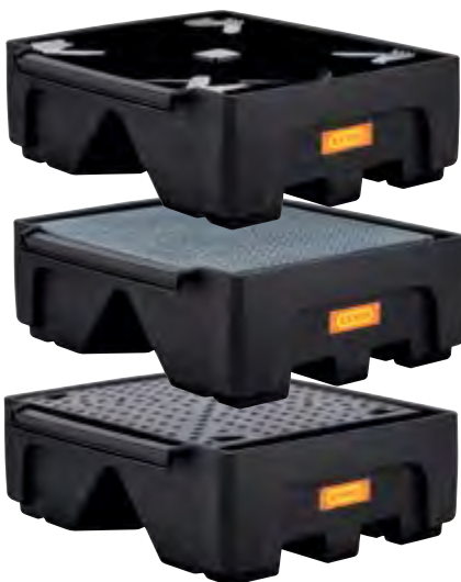
Bac CUBI-PE 500/1 sans caillebotis