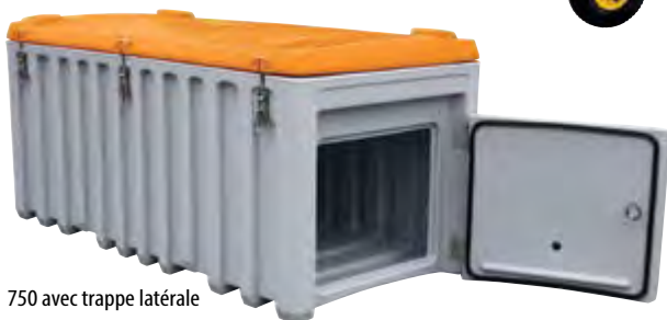
750 avec trappe latérale