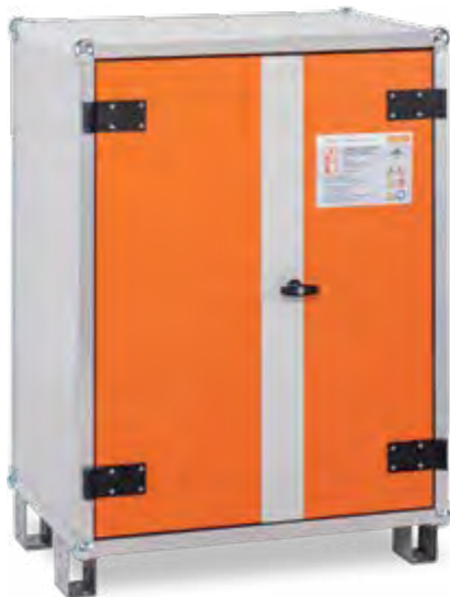
Armoire 8/10 Eco