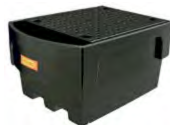
Bac CUBI-PE 1100/1 collecteur avec caillebotis PE