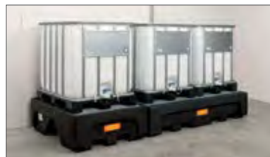
Bac CUBI-PE 500/1 caillebotis PE