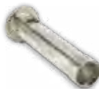
Tube de remplissage avec anneau pare-flamme