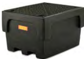
Bac CUBI-PE 1100/1 avec caillebotis PE