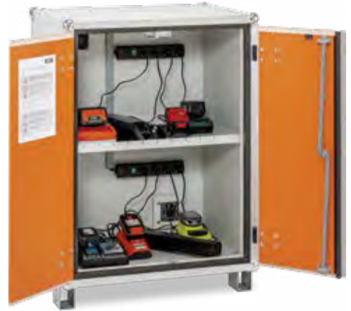
8/10 Premium SIM