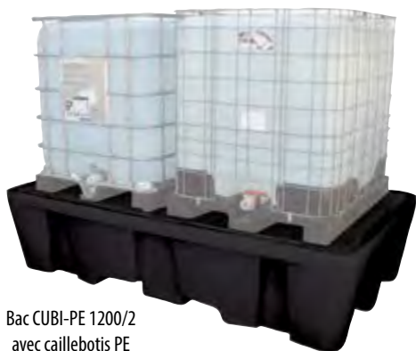
Bac CUBI-PE 1200/2 avec caillebotis PE