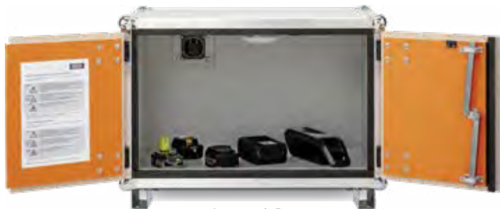
Armoire 8/5 Eco

Le système lockEX assure une décompression contrôlée en cas d'explosion. Les portes des armoires restent fermées.