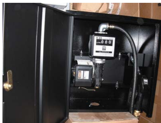
Caisson en acier peint (en option)