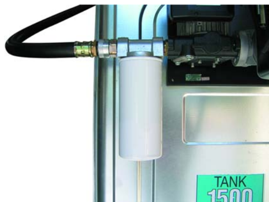
Filtre à absorption d'eau (en option)