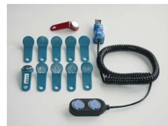
Jeu de clés et lecteur clé maître (réf 7891)