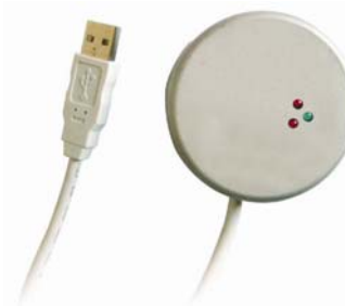
Connecteur PC (réf 7890)