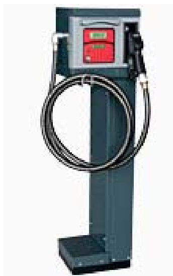
Piedestal en option (réf 7888)