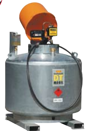
Double paroi acier galvanisé