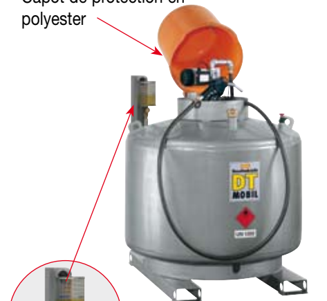
Double paroi acier laqué