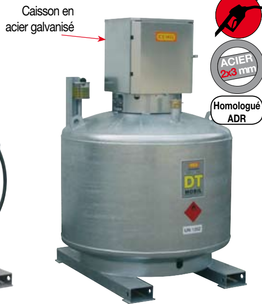
Version double paroi acier galvanisé avec caisson de protection