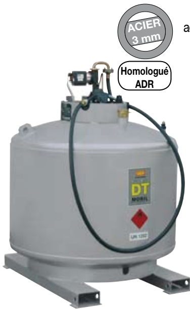
Version simple paroi laquée