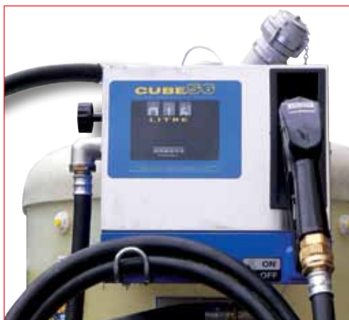
Pompe électrique carrossée, 56 l/min