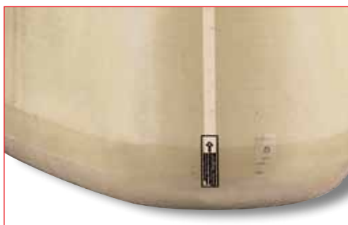
Témoin optique de fuite intégré dans la paroi de la cuve (système breveté) Classe de sécurité 3 selon norme NF EN 13160