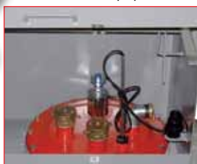
Trou d'homme d'inspection