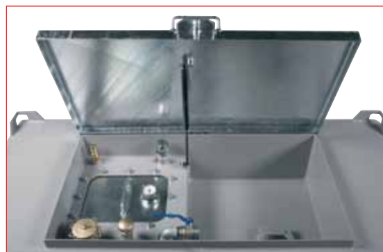
Coffre de protection