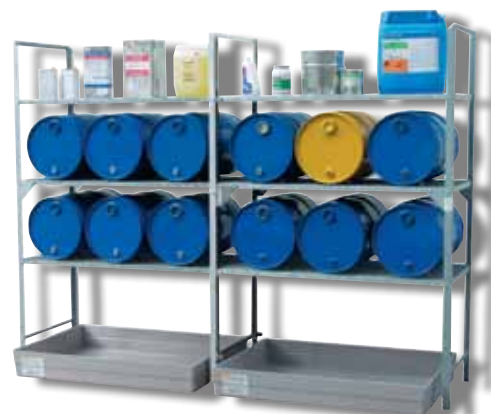
Rayonage 540 avec 1 module d'extension 540