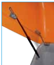
Vérin à gaz