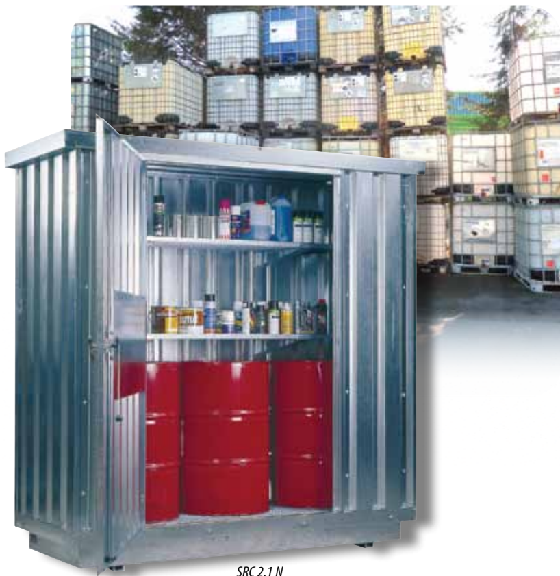
SRC 2.1 N