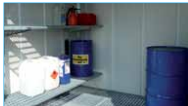
Exemple d'aménagement intérieur

Une distance minimale de 10 mètres au bâtiment le plus proche est conseillée. Prévoir des moyens de lutte contre l'incendie à proximité tel qu'un extincteur et un bac à sable.