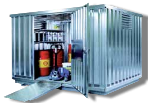
SRC 3.1 N et rampe d'accès avec grille d'aération haute (option) et micro-perforations des parois en bas