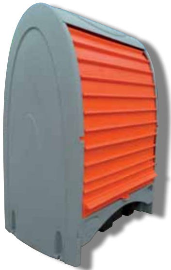
Box rétention PE2