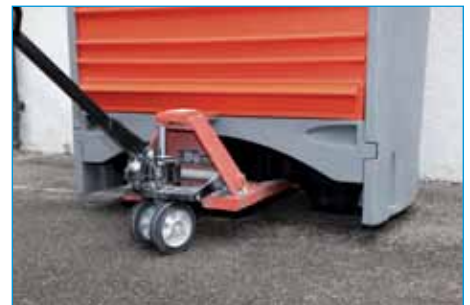
Passage de fourches pour chariot élévateur ou transpalette