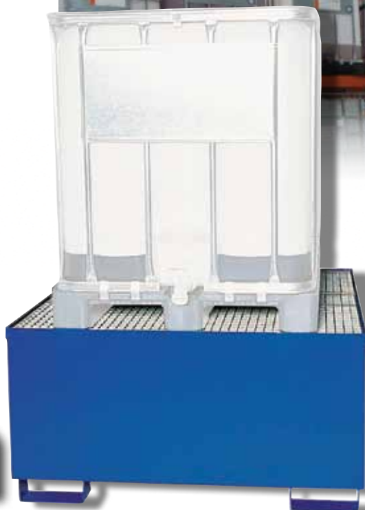
CUBI-ACIER 1 laqué