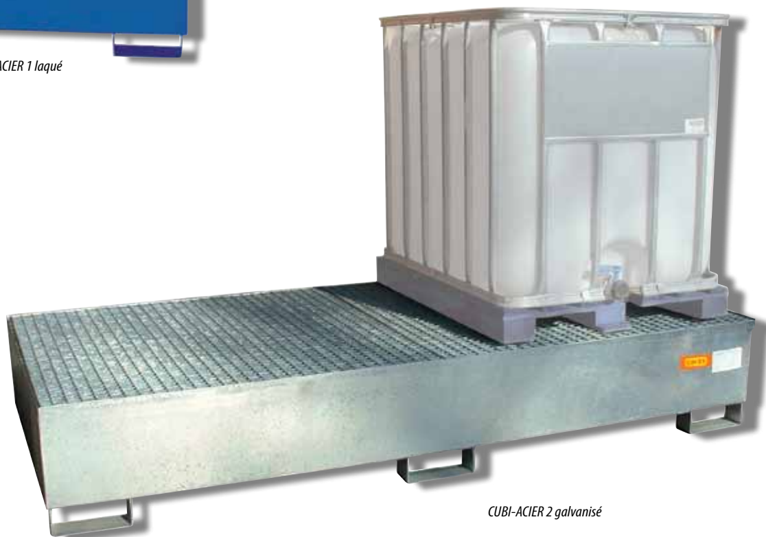
CUBI-ACIER 2 galvanisé