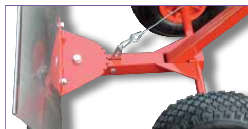
Commande de réglage du plateau