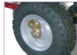
Système de débrayage