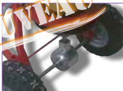
Renvoi d'angle renforcé