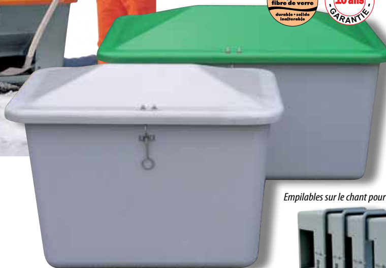
Empilables sur le chant pour un gain de place